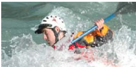
Alojamiento en el albergue de Murillo.