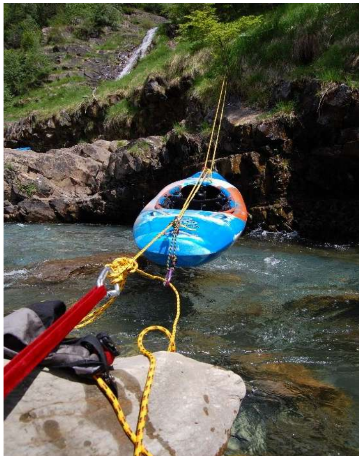
UR RESCATE PROVEEDOR RESCUE 3 EUROPA

En el camino haremos una evaluación continua, cada práctica, curso y entrenamiento lo valoramos y podremos hacer las modificaciones necesarias. Seguro que surgen dudas y situaciones que experimentaremos que nos darán bagaje para ser buenos profesionales.